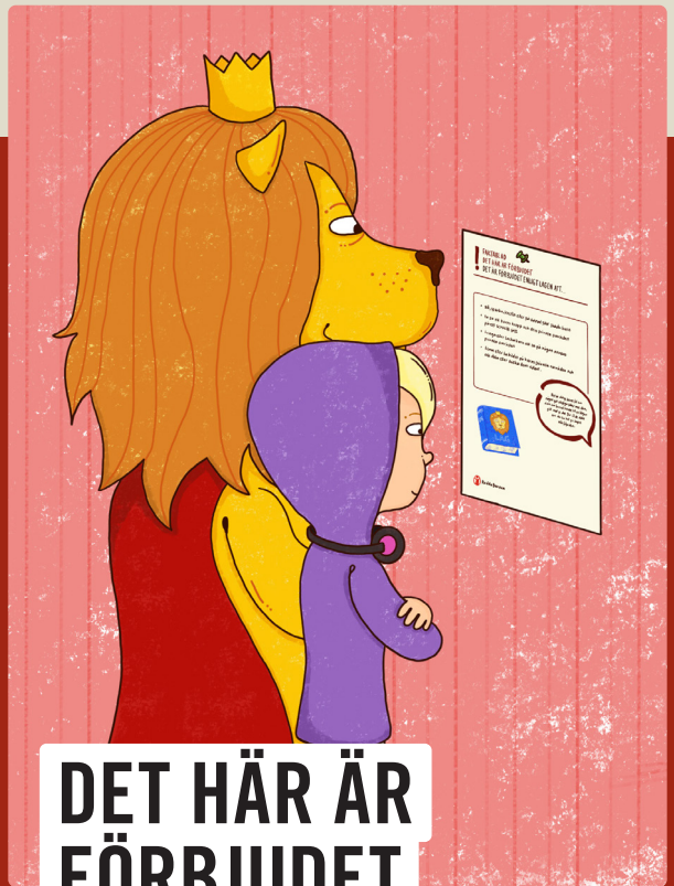
DET HÄR ÄR FÖRBJUDET FAKTAKORT