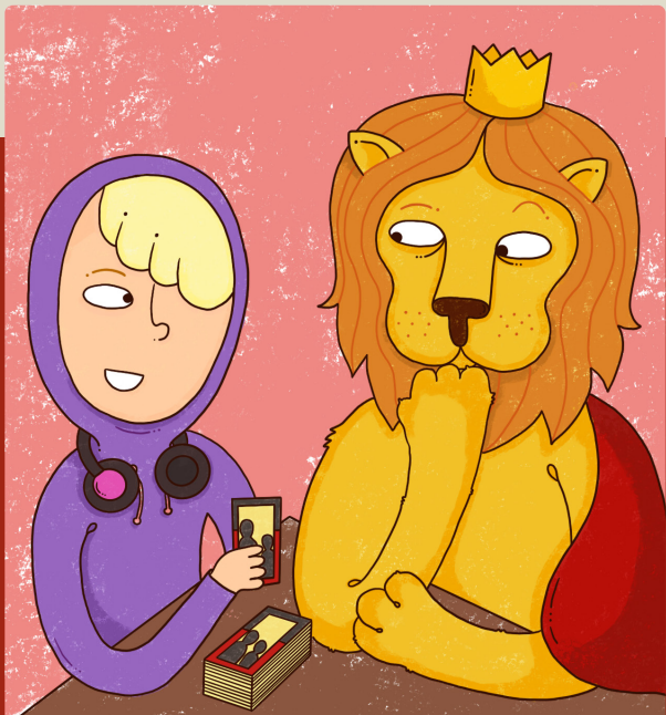
DET HÄR ÄR FÖRBJUDET FRÅGEKORT